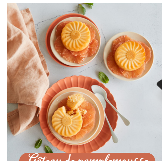
Gâteau de pampelousse

Flanc de chèvre Moelleux passion Tiramisu